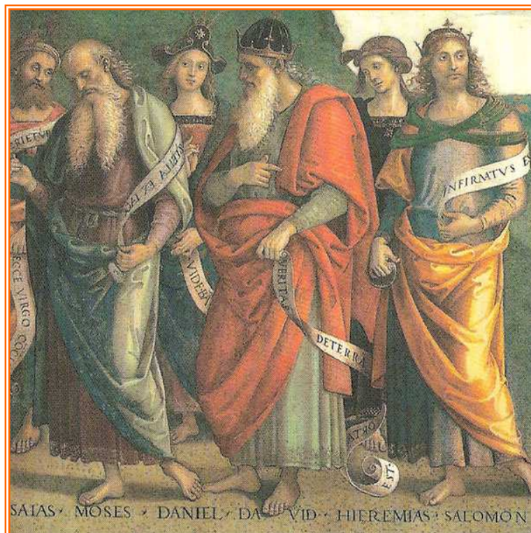
Profeti- Opera del Perugino

La prima lettura parla di profezia. Da sempre l'uomo ha cercato di indagare i misteri del regno invisibile, del regno dello spirito. Tutti hanno sempre cercato di capire la loro vita, interrogando altri spiriti, i morti, i maghi, gli indovini, tanto che nella Scrittura è passato questo comando in Deuteronomio 18, 10-11 , dove si dice: Non si trovi in mezzo a voi chi esercita la divinazione, la magia, né chi faccia incantesimi, consulti gli spiriti o indovini o interroghi i morti . Questa è una consuetudine deleteria. Alcuni si giustificano così: - Ho consultato il mago, tanto per... - Ma non è che si prenda il veleno, tanto per... Questi consulti aprono delle finestre al mondo degli spiriti e difficilmente si riesce a liberarsene. La prassi migliore è interrogare il Signore, il quale ci fa capire, momento per momento, dove dirige la nostra vita.